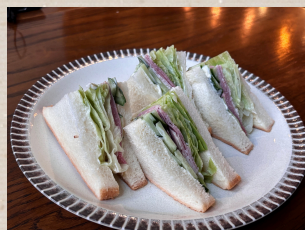
白ハムときゅうりの サンドイッチ ¥770