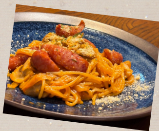
美味しい ナポリタン ¥1100