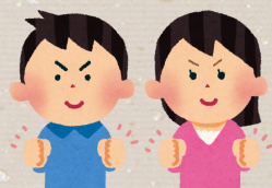
キッズスペシャルプレート ¥880

お子様限定のスペシャル プレート、ワンプレートに おいしさを詰め込みました フルーツゼリー付き