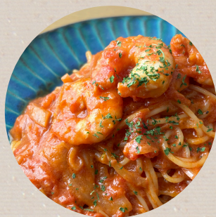
エビトマ クリームパスタ ¥1320