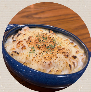
国産若鶏の チキングラタン ¥990