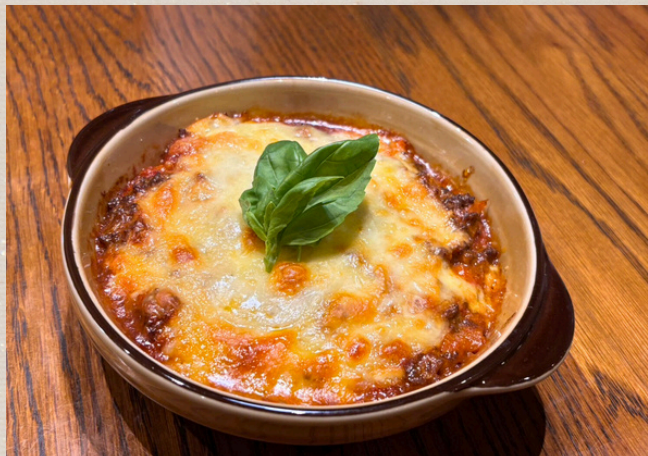
シェフの特製ラザニア ¥1650

4層のラザニアに濃厚な自家製ボロネーゼソースととろとろチーズをたっぷりかけてご提供。 旨みが業種記された贅沢な味わい。